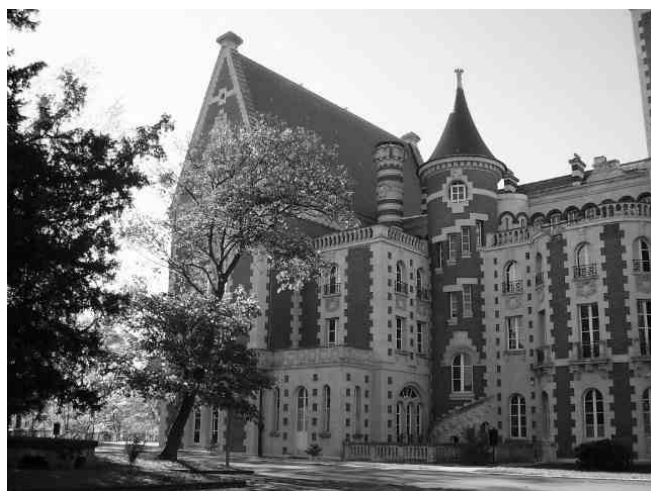
Lycée International, in Saint-Germain en Laye

Zijn er schoolgelden verbonden aan het Lycée International? Op deze en andere vragen zal de heer Thijssen tijdens de lezing ingaan. Bij deze Onder Ons vindt u een brochure over het Lycée International met meer informatie.